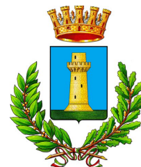
Comune di Russi